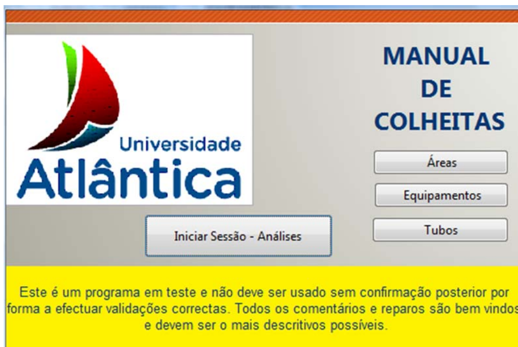
Fig. 1 –Ecran principal do Manual de Colheitas Electrónico

No Manual de Colheitas são listados, a título informativo os volumes mínimos necessários para efectuar cada análise isoladamente.