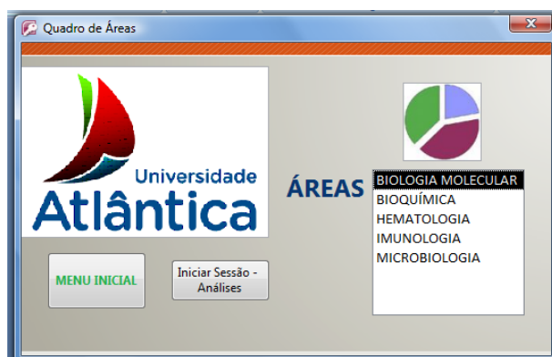
Fig. 5 – Menu de Áreas

Neste “Menu inicial”, após escolher a opção “Áreas” e seleccionando uma delas ( Hematologia, Bioquímica, Imunologia, Microbiologia e Biologia molecular) é possível aceder as análises que lhe estão relacionadas, através da opção “Iniciar Sessão – Análises”. Neste menu é ainda possível voltar ao “Menu inicial”.