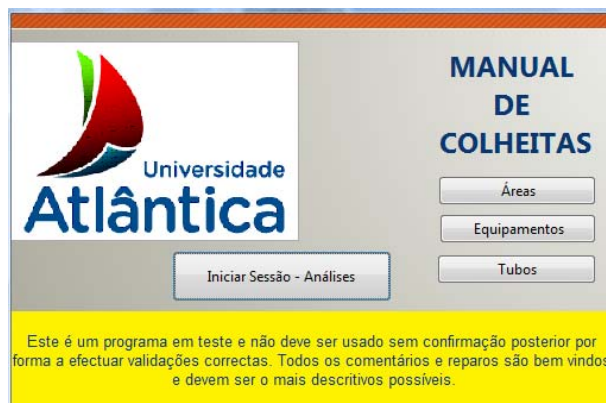
Fig. 4 – Menu inicial

O desenho do programa (em MS Access®) com a apresentação do Manual de Colheitas é iniciado por um quadro (Menu Inicial) composto pelas áreas de colheitas, os equipamentos a utilizar bem como os tubos.