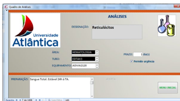
Fig. 8 – Menu de Análises

Na opção de análises (Iniciar Sessão – Análises) ficam disponíveis os diferentes parâmetros analíticos que podem ser seleccionados ou pesquisados os requisitos necessários à sua execução.