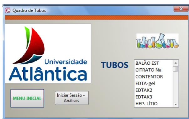
Fig. 7 – Menu de Tubos

Quando da selecção do “Menu Tubos” ao ser seleccionado um tipo de tubo, podem ser consultadas as análises onde o mesmo é utilizado.