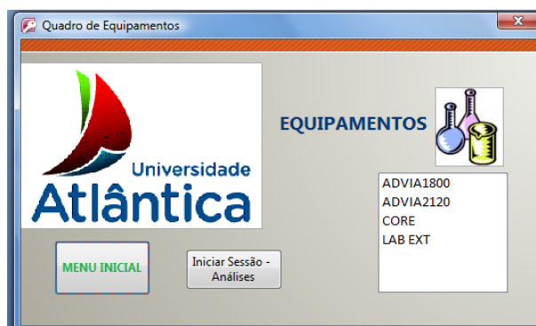
Fig. 6 – Menu de Equipamentos

Quando da selecção do “Menu Tubos” ao ser seleccionado um tipo de tubo, podem ser consultadas as análises onde o mesmo é utilizado.